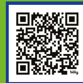
Page web dédiée EEE Occitanie

Je reste informé.e en m'abonnant à la lettre d'information EEE Occitanie , en suivant les réseaux sociaux du CEN Occitanie et en consultant le Tableau de bord EEE Faune .