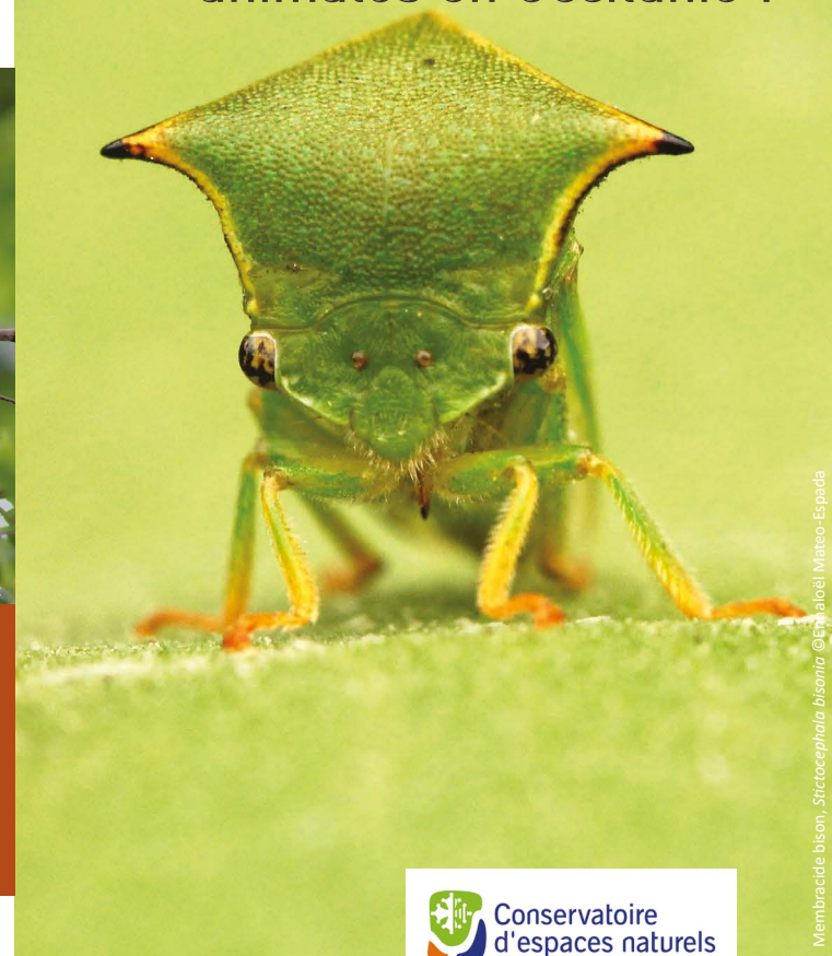
Membracide bison, Stictoccephala bisonia