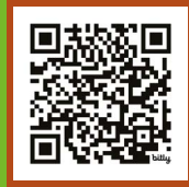
Outil de signalement

Je suis vigilant.e et je signale la présence d'une EEE grâce à l' outil de signalement . Si j'ai un doute, je peux consulter la liste des EEE animales de la région sur la page web dédiée .