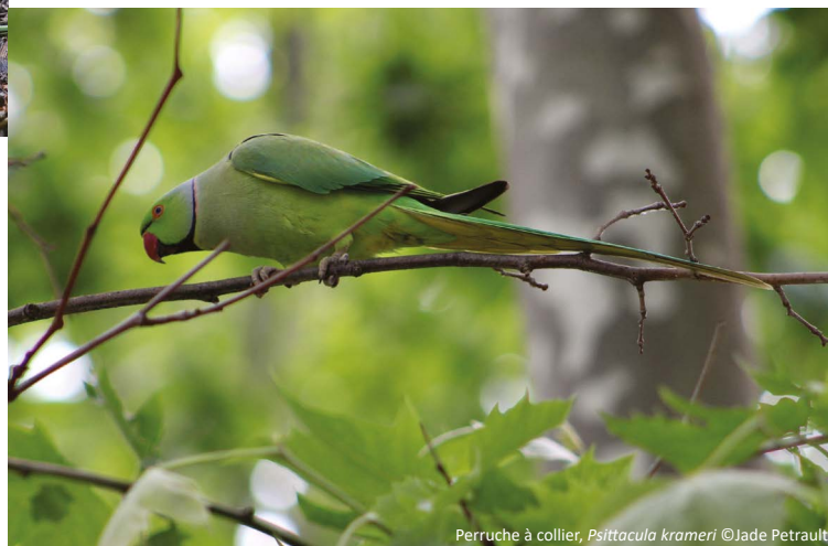
Perruche à collier, Psittacula krameri

Pour découvrir tous les documents et outils relatifs aux espèces exotiques envahissantes faune & flore :