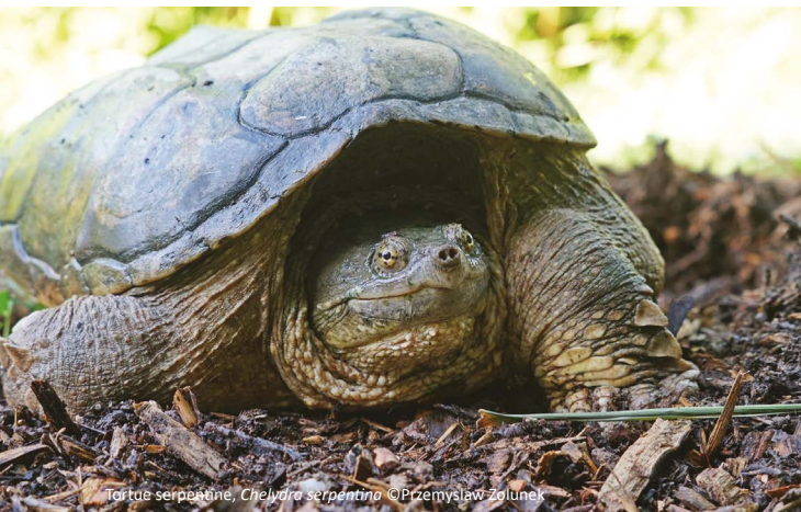
Tortue serpentine, Chelonia serpentina