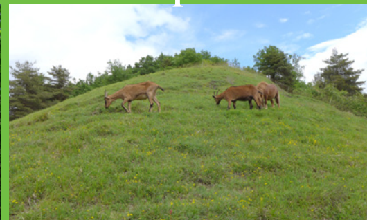
coteau préservé grâce au pâturage