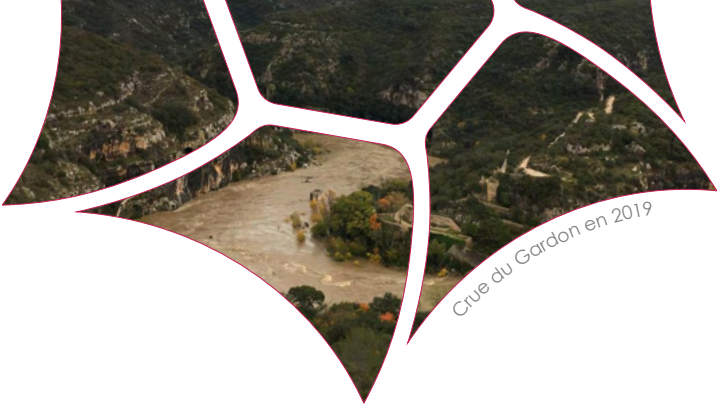
Crue du Gardon en 2019