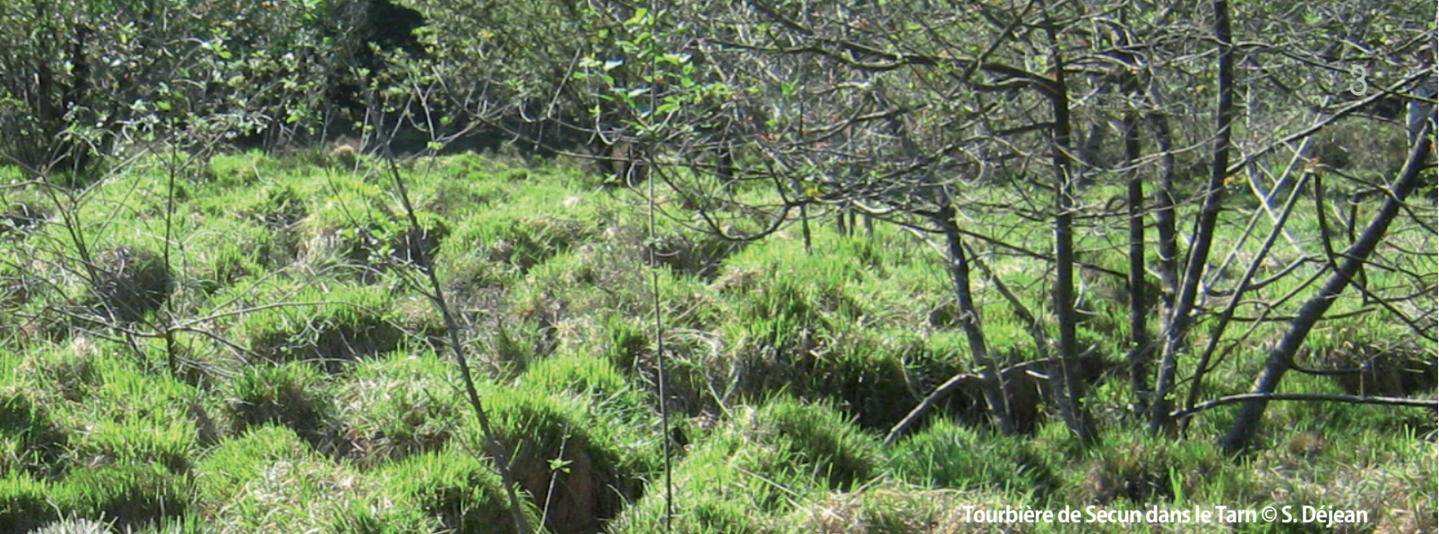
Tourbière de Secun dans le Tarn