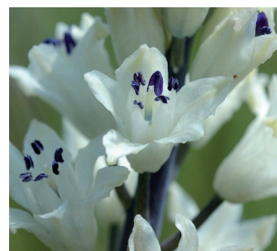
Jacinthe de Rome

Partenaires : Agence de l'Eau Adour-Garonne, DREAL, SAFER GHL, CBNPMP, ABG, CPIE 32