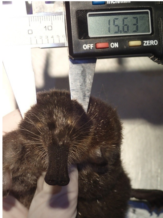
Action D3 – Mesure de largeur sur un spécimen.