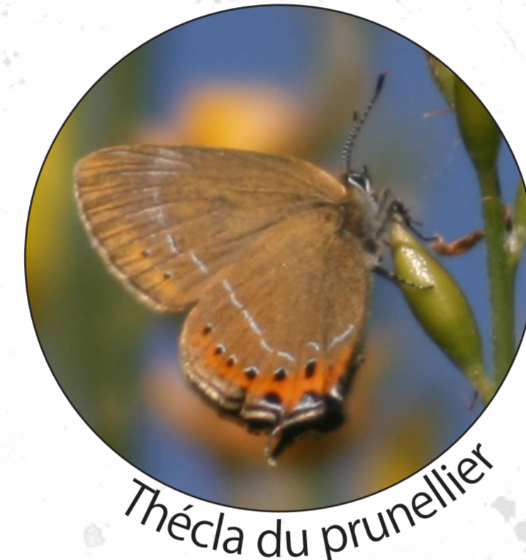
Thécia du prunellier