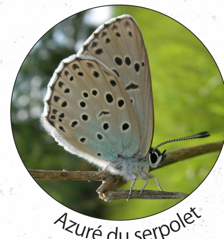
Azuré du serpolet