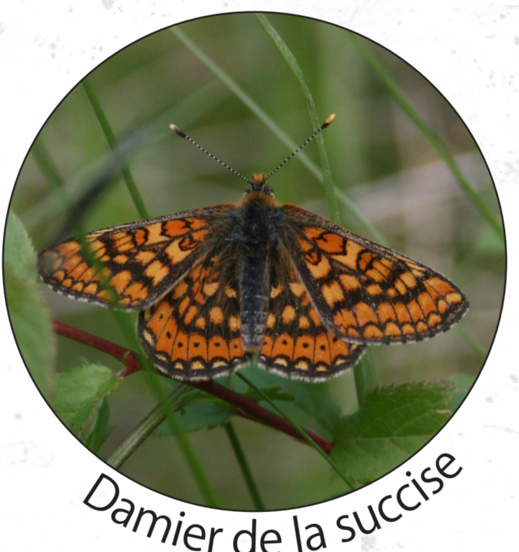
Damier de la succise