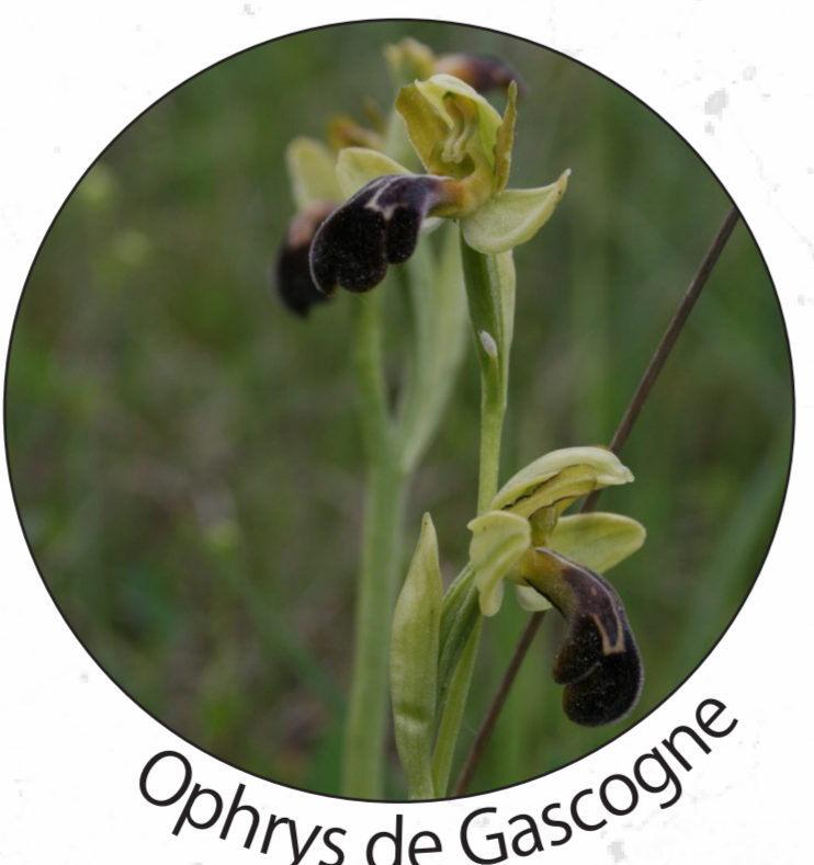
Ophrys de Gascogne