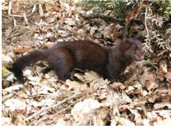
Vison d'Amérique

En Espagne, le Vison d'Amérique est considéré comme un des principaux prédateurs du Desman. Il s'agit d'une espèce écologiquement très agressive vis-à-vis d'espèces à écologie proche comme le Vison d'Europe ou le Putois. Son contrôle pourrait apparaître comme une priorité dans le cadre du Plan National d'Actions en faveur du Desman des Pyrénées.