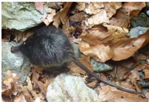
Desman des Pyrénées en Ariège