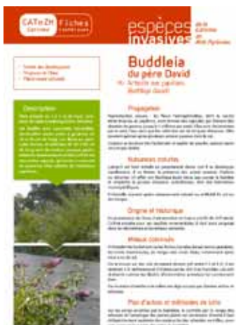
Fiche technique Buddleia éditée par Nature Midi-Pyrénées

Plan d'actions et méthodes de lutte contre le Buddleia : Sur les zones envahies par le Buddleia, le contrôle par la coupe des arbustes et l'arrachage des