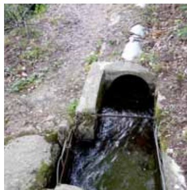
Exemple de canal d'irrigation devenant tubulé

sans que l'on ait pu cependant diagnostiquer la cause de la mort.