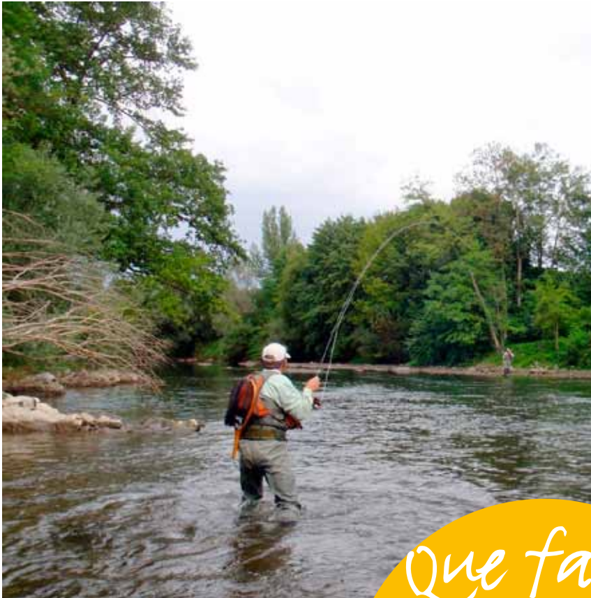
Pêcheur de truite à la mouche