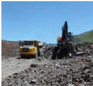
Travaux d'aménagement d'une piste de ski