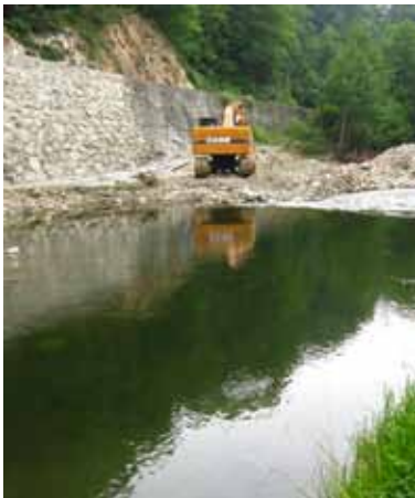
Travaux sur un cours d'eau

Les chantiers routiers peuvent être à l'origine de rejets de sédiments plus ou moins importants dans les milieux aquatiques environnants susceptibles de colmater les habitats. L'installation d'une carrière ou d'une mine en amont de cours d'eau est susceptible de générer les mêmes impacts lors de son exploitation.