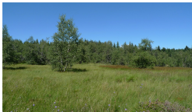
Ambiance de tourbière, en tête de bassin de l'Ance du Sud

Dans le cadre de la mise en œuvre du plan de gestion stratégique des zones humides du bassin versant de l'Ardèche, le Cen Lozère a réalisé en 2019 l'inventaire des zones humides sur le bassin du Chassezac dans le cadre d'une convention de collaboration avec l'établissement public territorial du bassin de l'Ardèche.