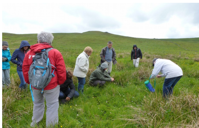
Inventaire de la flore participatif sur le site du Puy de Gudette (réseau SAGNE48) dans le cadre des Atlas de biodiversité communale du PNR Aubrac

C'est un outil financier proposé par l'Agence de l'eau Loire-Bretagne dans le but d'améliorer la qualité de l'eau, des rivières et des milieux humides à l'échelle d'un bassin versant, en lien avec les objectifs de la Directive Cadre Européenne sur l'Eau. Il comporte une phase d'élaboration (études préalables et proposition d'un programme) et la phase de mise en œuvre.