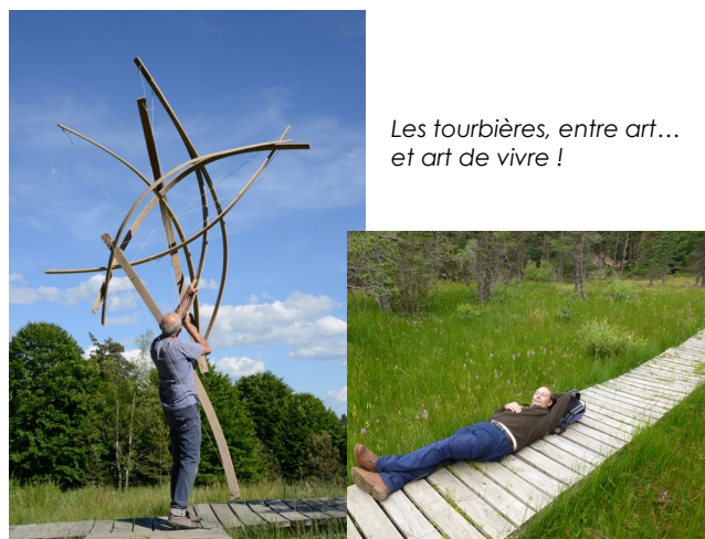
Les tourbières, entre art... et art de vivre !

En appui à la création, les animations proposées durant l'été, l'implication de l'équipe municipale et des habitants du village a largement contribué au succès du projet. Plus de 80 personnes ont participé aux temps forts (journée inaugurale et sorties). Un grand merci à Denis et Dominique, à l'équipe municipale et aux bénévoles !