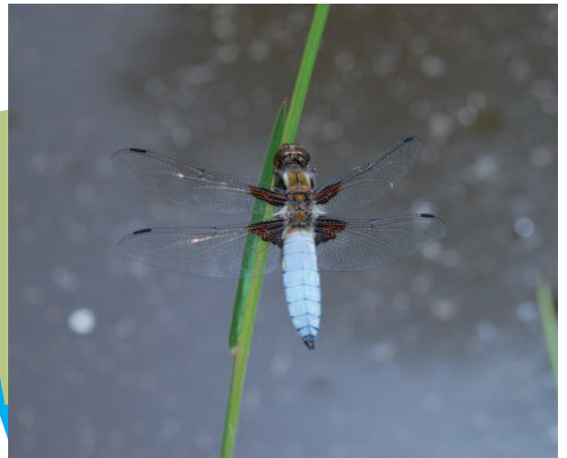
Le petit peuple de la mare (Pierre Clavel)