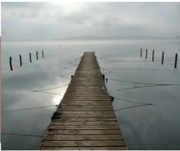
Lagune de Bages Sigean (Nicolas Diet)

Ci-dessous notre sélection des photos envoyées pour le défi photographique lancé à l'occasion de la journée mondiale pour les zones humides : de près ou de loin, des sources aux lagunes, chez nous comme au bout du monde, les zones humides sont des invitations au voyage...!