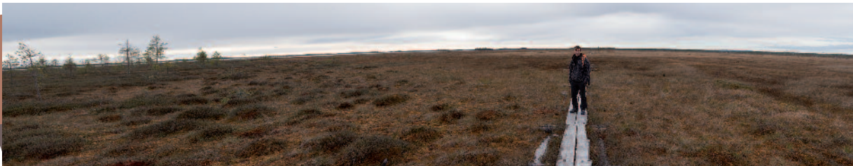
et la Finlande (Samuel Chazalmartin)