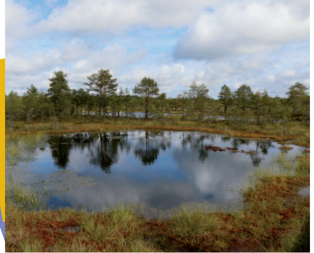
...à l'Estonie (Michel Quiot)