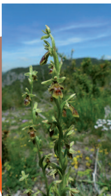
L'Ophrys d'Aymonin, orchidée endémique des causses