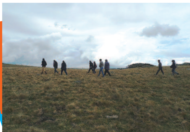
Octobre 2016, Aubrac, session d'échanges sur la gestion pastorale des landes et tourbières, animée avec le Cen Auvergne et le Civam Empreinte