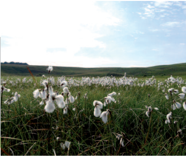
... en passant par l'Aubrac (Hervé Picq)