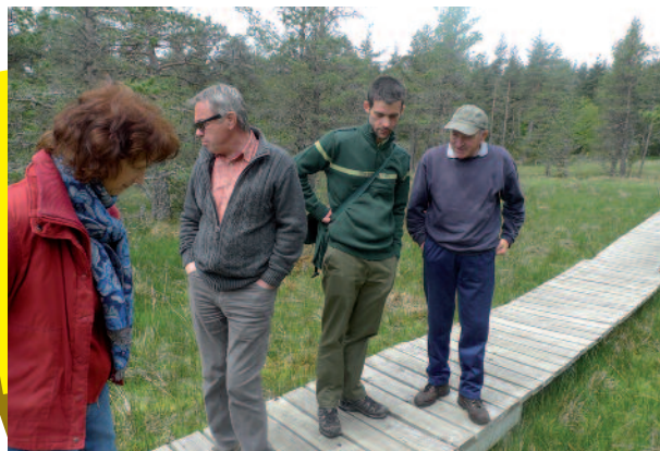
Sentier des tourbières, comité de gestion du site de Lajo, 26 mai 2016

Des gestionnaires qui s'engagent pour la préservation de la biodiversité et la connaissance des milieux naturels en Lozère : Fin 2016, 53 partenaires sont engagés avec le Conservatoire pour la gestion durable de plus de 2080 hectares répartis au sein de 54 sites.