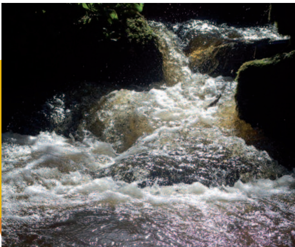
Phot'Eau (sans titre!) (Philippe Ginestet)