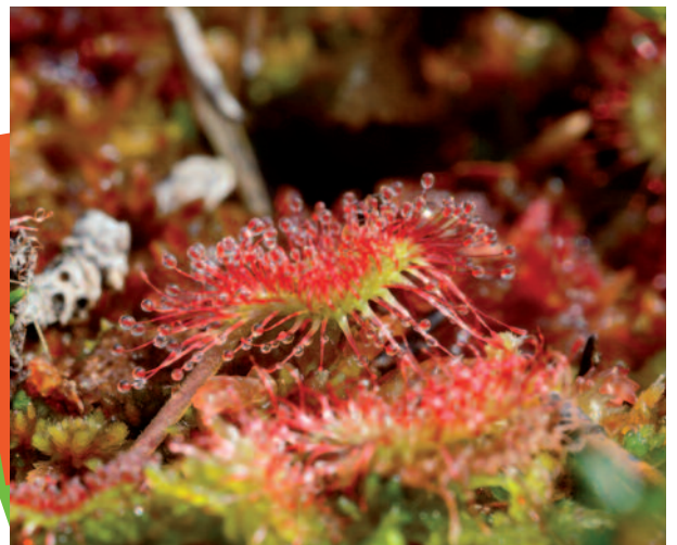
L'inénarrable Droséra à feuilles rondes (Michel Quiot)