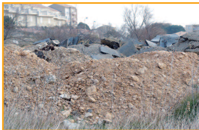
Ceci est une zones humide ! (Nicolas Diet) Défi photo spécial zones humides : catégorie « la photo malheureusement parlante »

• pour signer la pétition : www.change.org/p/soutenez-la-motion-sur-la-protection-des-zones-humides