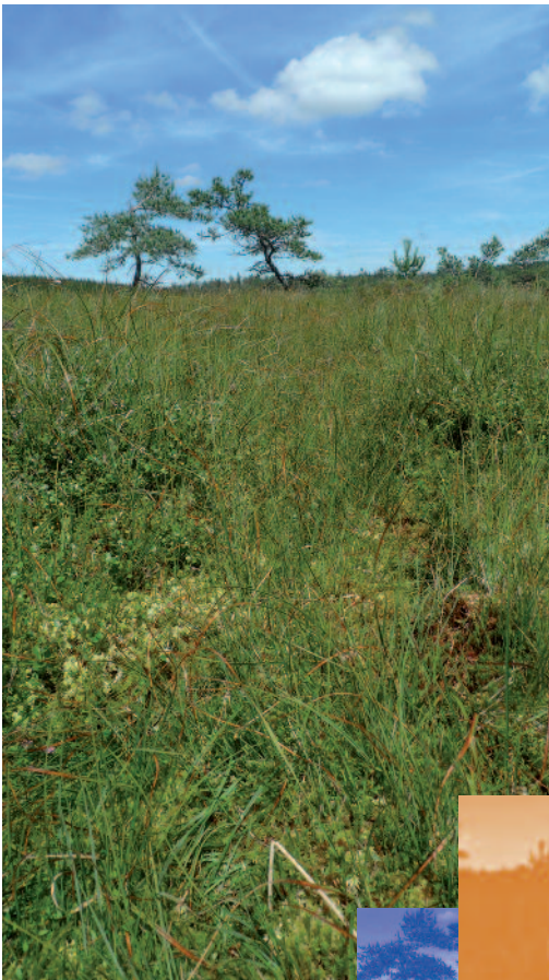
Tourbière des Crozes, Lajo (réseau SAGNE 48)

Les secteurs de moyenne montagne ne sont pas exempts de menaces et pressions sur les milieux naturels, les disparitions de pelouses sèches calcaires et de milieux humides constituant la partie la plus visible de l'iceberg. Ces constats sont des signaux d'alarme pour le développement de stratégies de conservation, en Lozère comme ailleurs, stratégies qui ne sont pas synonymes de « mise sous cloche », mais qui doivent reposer sur une véritable intégration de la biodiversité (dont nous faisons partie) dans nos activités et certainement sur l'acceptation d'autres rapports à la nature.