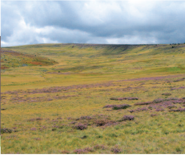
Des sources du Tarn... (Nicolas Diet)