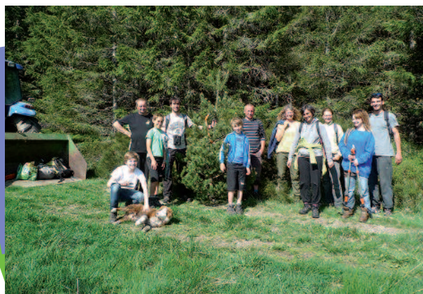
28 mai 2016, chantier de bénévoles à Auranchet